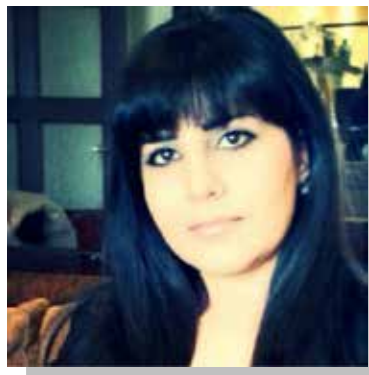
بقلم أريج الرشيد

على نقيض الثقافات والشعوب الأخرى التي تحترم أصحاب الشهادات والنفوذ وتتنظر بإزدراء إلى من يمتنح الأعمال والمهن الصغيرة .